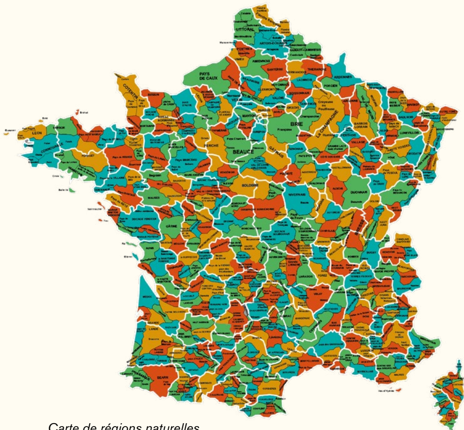
Carte de régions naturelles